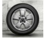
Rin 16" Revolute Spoke.

Equipamiento interior. • Aire Acondicionado Automático. • Asientos delanteros con ajuste de altura. • Detalles en Piano Black. • Reposabrazos delantero. • Espejo Retrovisor Electrocrómico. • MINI Driving Modes: Sport, Mid y Green. • Volante de cuero multifuncional deportivo. • Panel de Instrumentos Digital.