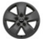
Rin 16" Revolute Spoke.