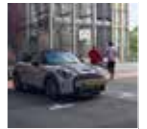
Rin 17" Rail Spoke Bi-Tono.

Equipamiento exterior. · Faros LED delanteros y traseros con diseño Union Jack. · Líneas en el cofre: negras o blancas. · Toldo y retrovisores: blanco, negro o color de la carrocería. · Paquete de espejos exterior. Espejos abatibles electrónicamente. · Techo panorámico. · Rin 17" Rail Spoke Bi-Tono.