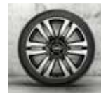
Rin 17" Rail Spoke Bi-Tono.

Equipamiento exterior. · Faros LED delanteros y traseros con diseño Union Jack. · Líneas en el cofre: negras o blancas. · Toldo y retrovisores: blanco, negro o color de la carrocería. · Paquete de espejos exterior. Espejos abatibles electrónicamente. · Techo panorámico. · Rin 17" Rail Spoke Bi-Tono.