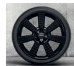
Rin 18" Pulse Spoke black.