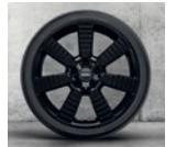
Rin 18" Pulse Spoke black.