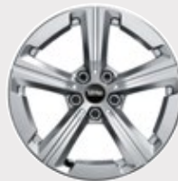
Rin 17" Spoke Grey.