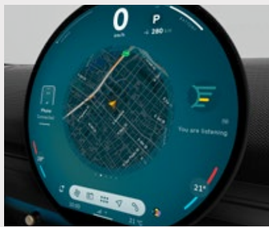
Unidad interactiva MINI. Pantalla central OLED con un área de 440 cm 2 .