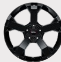
Rin 19" John Cooper Works Runway Spoke Black.