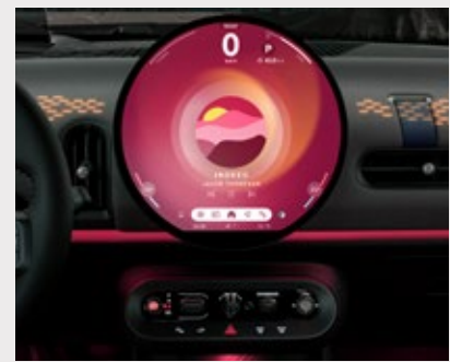
MINI Experience Modes: Go Kart, Green, Core, Personal, Timeless, Vivid, Balance.