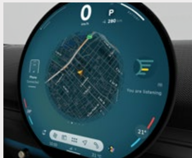
Unidad interactiva MINI. Pantalla central OLED con un área de 440 cm2.