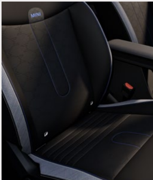
E / SE ALL4: Asientos de piel sintética en combinación con tela.