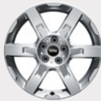
Rín 18" Asteroid Spoke.