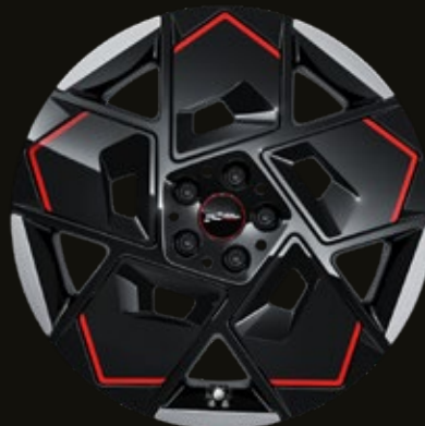
19" John Cooper Works Strive Spoke 2-tone.