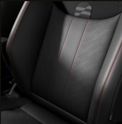
Asientos deportivos de piel sintética en combinación con tela.

* Combinación de todo dependiendo del color de la carrocería