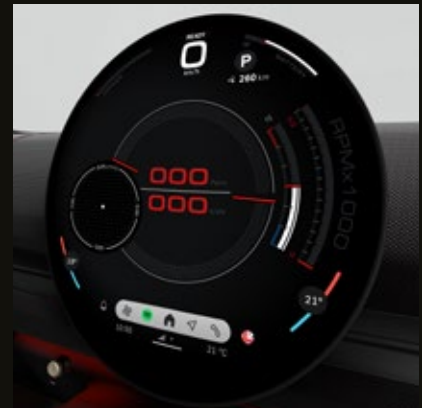
Unidad interactiva MINI. Pantalla central OLED con un área de 440 cm 2 .