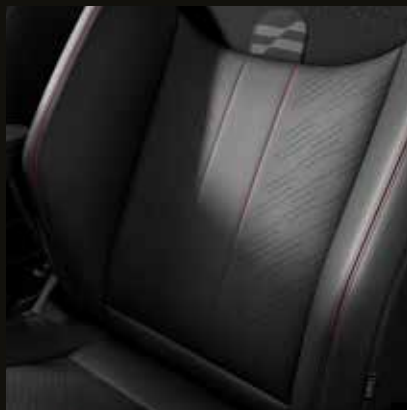
Asientos deportivos de piel sintética en combinación con tela.

* Combinación de todo dependiendo del color de la carrocería