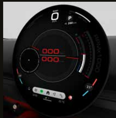
Unidad interactiva MINI. Pantalla central OLED con un área de 440 cm 2 .