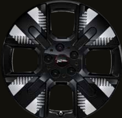
18" John Cooper Works Mastery Spoke black.