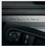
Umbral de puerta con mensaje "Everyday is a new beginning".