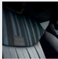
Diseño interior "Paul Smith".