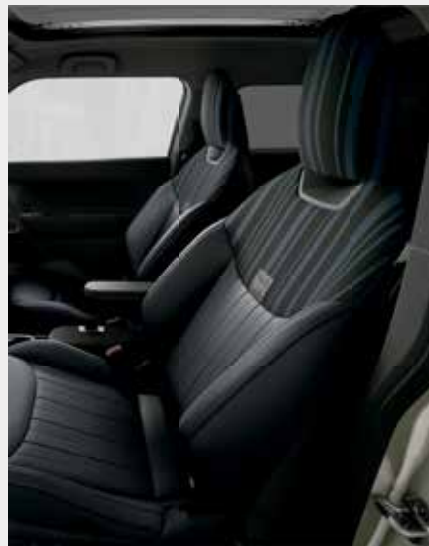
Asientos deportivos JCW en color "Nightshade Blue" con etiqueta "Paul Smith" y diseño "Shadow Stripe" en la zona de la cabeza y de los hombros.