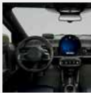
Panel de Instrumentos y Panel de Puertas con tejido de punto.