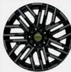
Rin 18" Night Flash spoke black.