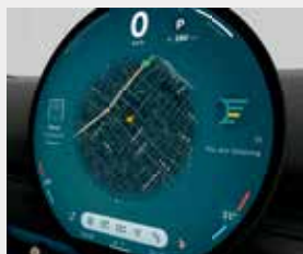
Unidad interactiva MINI. Pantalla central OLED con un área de 440 cm 2 .