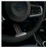
Stripes de colores en volante "Paul Smith".