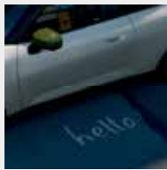
Retrovisores con proyección "Hello".