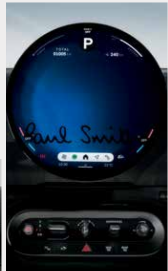
MINI Experience Modes: Go Kart, Green, Core, Personal, Timeless, Vivid, Balance. En modo personal se ofrecen tres fondos diseñados por "Paul Smith".

(4) Color de exterior y combinación de techo sujeto a la disponibilidad de la versión.