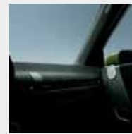
Detalles interiores en "Dark Steel".