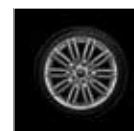
Rin 17" Tentacle Spoke.

Equipamiento Exterior. · Faros de LED para niebla delanteros y traseros. · Faros LED delanteros y traseros con diseño Union Jack. · Líneas en el cofre: Negras o blancas. · Techo Panorámico. · Toldo y retrovisores: Blanco, negro o color de la carrocería.