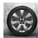
Rin 17" Imprint Spoke RF.