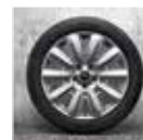
Rin 18" Pin Spoke FR.