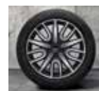
Rin 18" JCW Thrill Spoke.